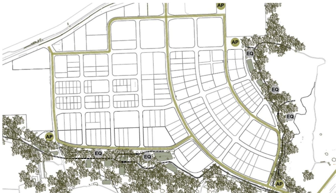
Mapa que recoge cómo serían las dos supermanzanas que contempla el plan director de Las Atalayas.

Así, una de las primeras iniciativas en la que ya se trabaja es en el apaciguamiento y la reordenación del tráfico dentro del propio recinto, con la creación de lo que el equipo redactor ha denominado las « no rotondas » y las supermanzanas . Este último es un concepto que ya se está utilizando en ciudades como Barcelona para distribuir la circulación de vehículos por grandes vías y dar más espacio a los peatones en el resto de calles enmarcadas dentro del perímetro designado. De lo que no se tiene constancia es de su aplicación en entornos industriales.